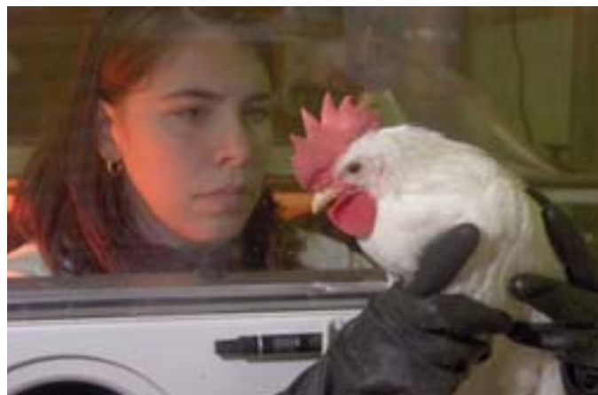
Ricercatori europei studiano i virus dell'influenza aviaria per sviluppare nuovi vaccini. Istituto zooprofilattico sperimentale delle Venezie, Italia.

Persino il XXI secolo non è indenne da nuovi agenti patogeni, come la SARS e l'influenza aviaria. Stanno inoltre riemergendo le malattie con un potenziale epidemico, come il colera e la febbre gialla.