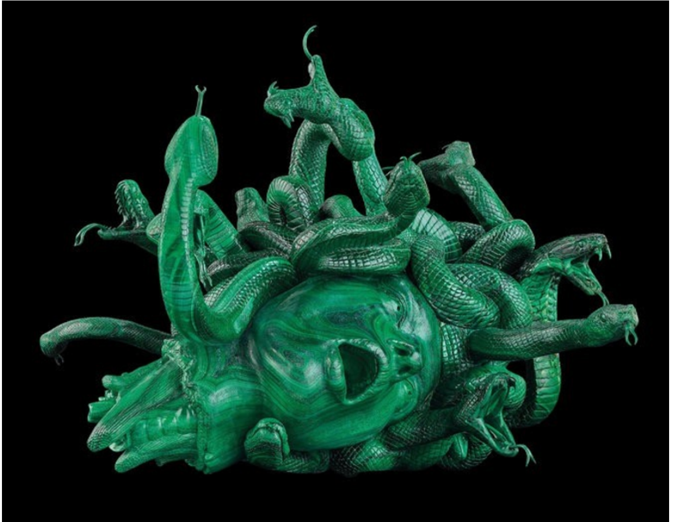
The Severed Head of Medusa. Credit Damien Hirst and Science Ltd.

All rights reserved, Artists Rights Society (ARS), New York, 2017; Photograph by Prudence Cuming Associates