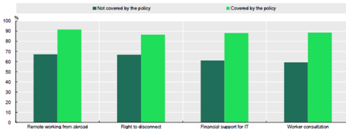
Share of teleworkers who report trust between workers and managers in their workplace, by policy coverage (%)