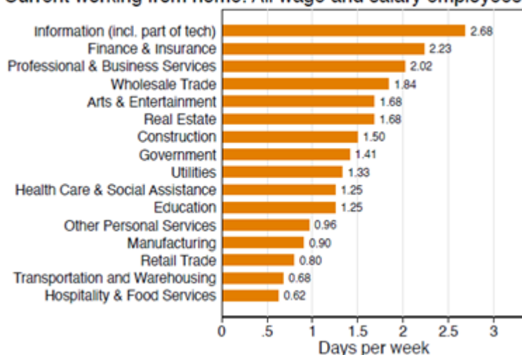
Current working from home: All wage and salary employees

L'ultimo dato scaturente dal sondaggio è quello per cui, se la percentuale di lavoratori da remoto è raddoppiata ogni 15 anni nel pre-pandemia, l'emergenza sanitaria ha portato a un aumento di cui si sarebbe fatta probabilmente esperienza tra circa 30 anni.