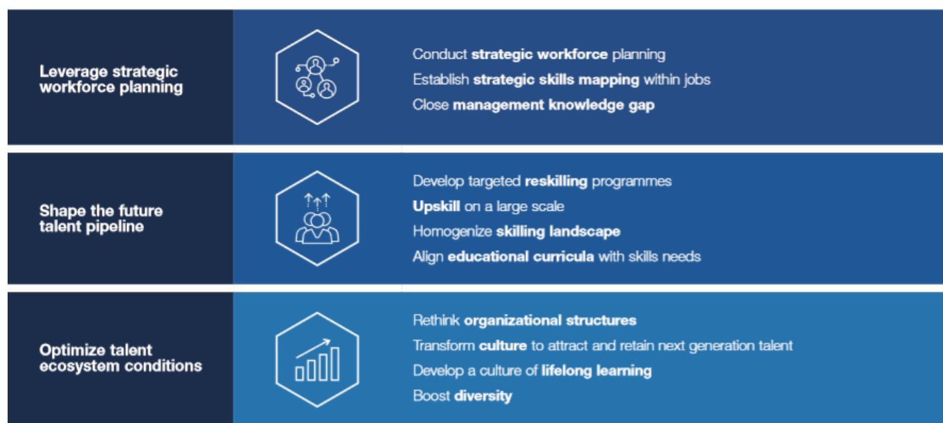
Table 9: Overarching recommendations

Sources: World Economic Forum and Boston Consulting Group.