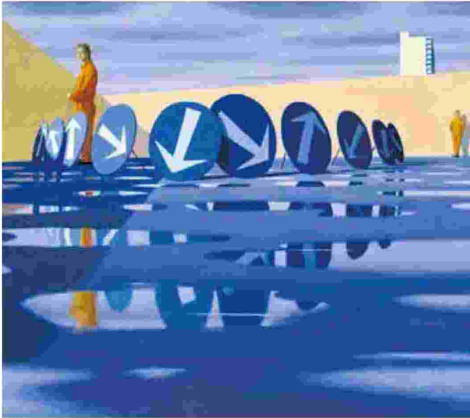
Un'opera di Jeffrey Smart

*magistrato, già Procuratore Generale di Firenze